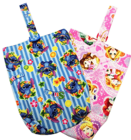
★上履き入れ 550円 (約27×20cm)