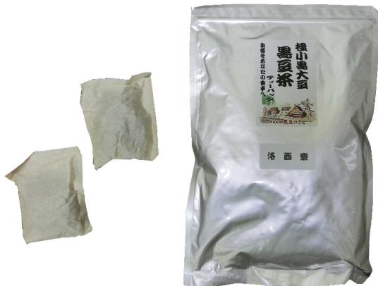
★黒豆茶 (12パック入り) 670円