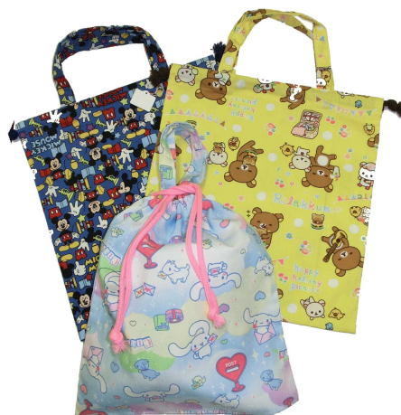
★体操服入れ 550円 (約31×28cm)