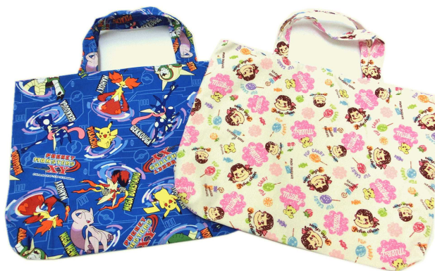
★手提げかばん 800円 (約30×40cm)