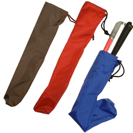
★白杖入れ 200円 (約35×8cm)