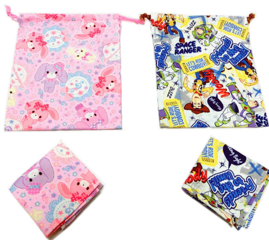
★給食袋セット (ナフキン入り) 650円 (約25×20cm、ナフキン40×40cm)