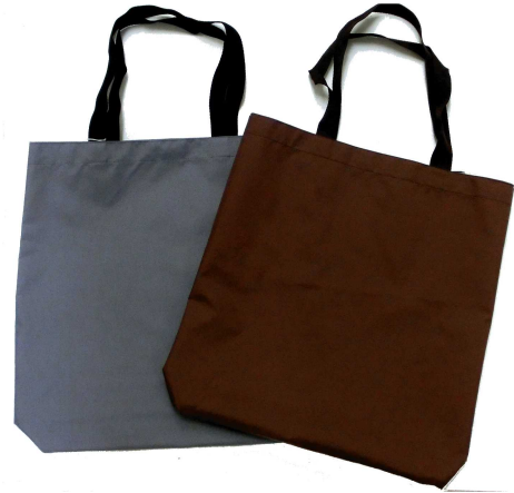
★買い物袋 100円～ (約32×35cm)