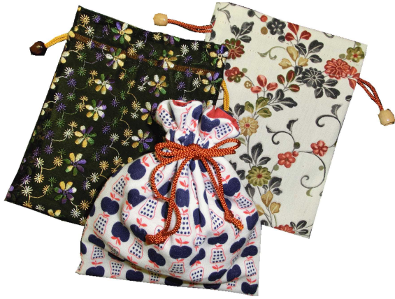
★巾着袋 400円～ (約20×15cm)