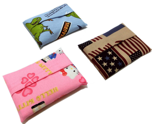
★ティッシュケース 50円～ (約9×12cm)