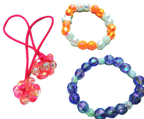
★ビーズアクセサリ 100円～